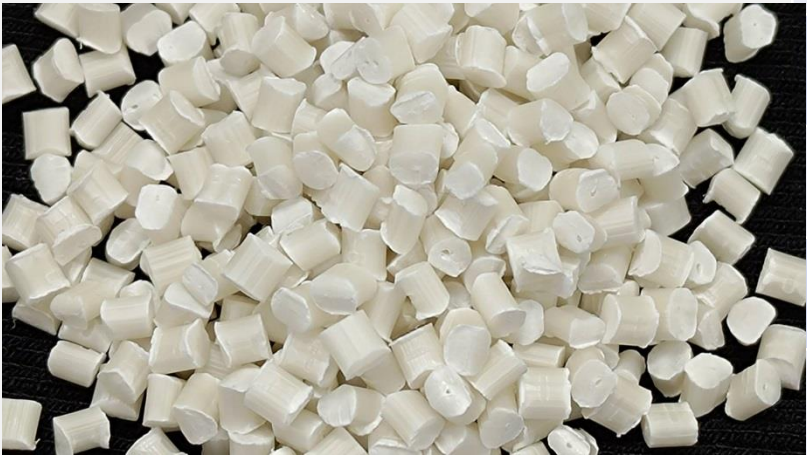
Master Batch 增硬母粒實體照片